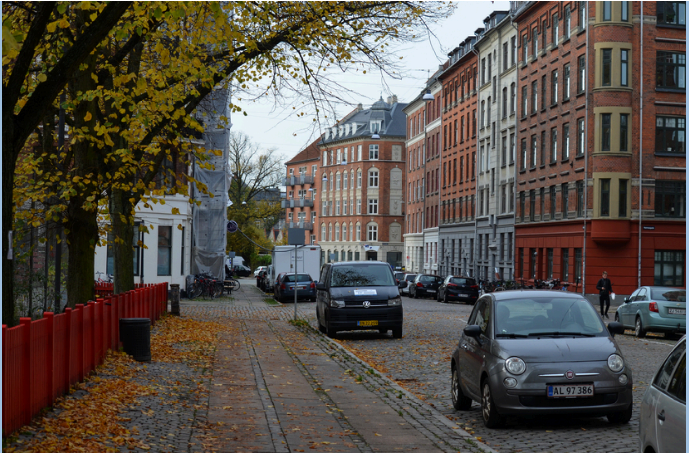
Baldersgade set mod syd ved krydset med Nannasgade.

Bygmestre Byvandring i København Metrovandring Podcast Om Hovedstadshistorie.dk